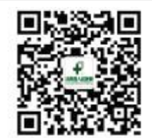
手机扫一扫 进入微信 微信账号 shuyanghospital 关注新浪微博:沭阳县人民医院

望着她带着孩子出院的身影,回想着来时愁苦的表情与现在一家欢乐的笑容,以及住院期间一幕幕情景,给我留下了许多思考……(医 舒)