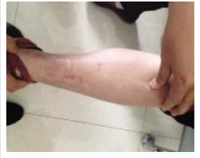
2月11日下午,我院召开今年首

我家的亲戚是胫腓骨骨折病人,就是采用Mipo技术,才如此完美。燕好军主任还利用Mipo技术给股骨骨折、肱骨骨折、胫骨平台骨折、锁骨骨折、盆骨骨折、Pilon骨折等为全身不同部位的骨折病人手术。近3年来,手术病人近1000例,均取得了优良效果。(刘平)