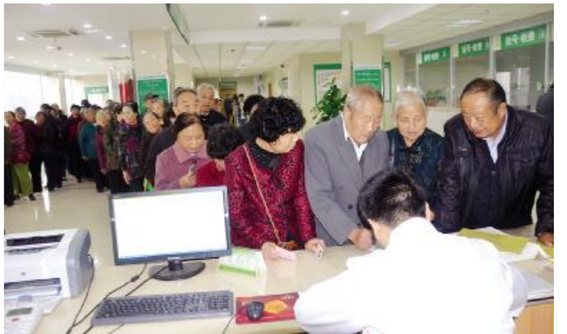
为提高老年人对健康的关注,我院连续四年为全县65岁以上老人免费体检,今年,为方便城区老人体检,专门在我院城区门诊部署安排医务人员为老人免费体检。 汪思

SHUYANG PEOPLE'S HOSPITAL 沐阳县人民医院 2015年11月 第11期 总第147期