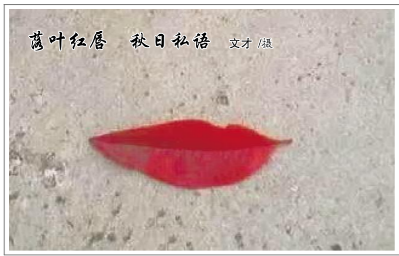
落叶红唇 秋日私语