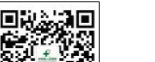
欢迎关注微信平台

提高社会满意度，和谐医患关系等具有重要意义。2015年初，经国务院批准，国家卫计委和国家中医药管理局联合下发了“进一步改善医疗服务行动计划”。在近一年的时间里，全国各地医院从改善环境、优化流程、科技支撑、提升质量、人文关怀、创新模式、建立机制、方便人民群众看病就医的措施，对促进医药卫生体制改革，