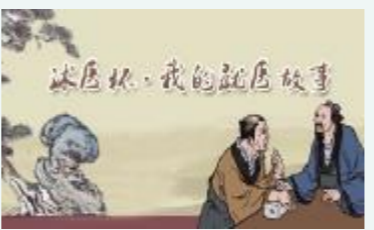
家三级乙等综合性医院,一直把担当社会责任、关注民生为己任。本次活动是沐阳县人民医院与宿迁报业传媒集团联合举办的又一次公益活动,由双方组织专人负责实施。活动由沐阳县人民医院全程赞助。