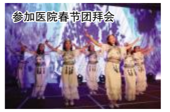
参加医院春节团拜会

这里的医技科室配备了先进的彩超、CT、DR，还有数字胃肠、心电图、脑电图、法国全自动荧光免疫分析仪、日本东芝全自动生化仪，设备与人民医院本部实现信息联网，建立区域影像和远程会诊中心，实现专家无线查房、远程会诊，资源共享。这里设有县120急救分站、胸痛中心分中心、贤官镇公共卫生服务中心，是县医保、新农合定点医院。危重患者开辟了人民医院急救绿色通道，随时可以向人民医院本部转诊。