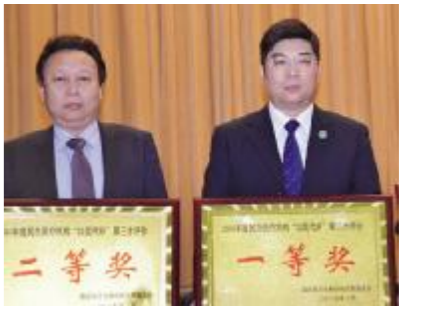
以提高医疗质量”为主题，倡导感动式服务，构建和谐医患关系，创建优质服务品牌，有力地促进了医院健康发展，圆满完成了全年目标任务。（龚志新/文 李影茜/图）

2016年，我院坚持“病患至尊、医德至上、医技至精、服务至馨、协作至诚”的价值观，策应新医改，谋篇布局，打造县乡村一体化医疗新模式，顺利通过三级乙等医院评审，招大引强，建成了吴阶平泌尿外科中心、胸痛中心、省人民医院口腔科沐阳分部，举办了建院80周年庆典，协办了全国民营医院联盟发展年会，荣获了全国“改善医疗服务示范医院”称号；城区门诊、韩山及马厂分院开业，贤官分院建成，城西分院封顶，生活区开工；全院医务人员坚持“以病人为中心，