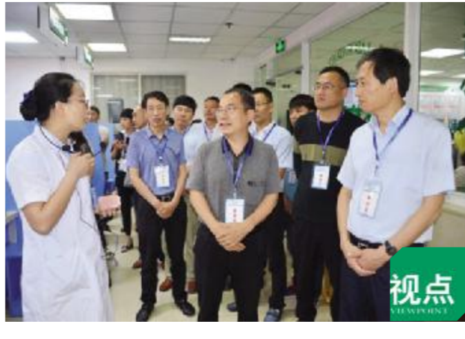
与会人员还参观了我院预约诊疗、影像云平台、先诊疗后付费、志愿服务、远程会诊中心、肿瘤及慢病多学科会诊中心等改善医疗服务的亮点。(范 菱/文)

6月22日,县卫计委在我院召开了“沭阳县进一步改善医疗服务现场交流会”。全县二级以上医疗机构、乡镇医院业务院长共计100余人参加了会议。 会议由县卫计委副主任董晓雪主持,我院等7家医疗机构业务院长针对本单位改善医疗服务行动计划落实情况分别作了汇报,院长们从推行肿瘤多学科联合诊疗、坚持出院随访、加强延伸护理服务、推广中医适宜技术等进行了经验分享。市卫计委张勇副主任充分肯定了沭阳县“进一步改善医疗服务行动计划”实施一年来所取得的成效,同时对下一步改善医疗服务工作提出了要求,强调要继续坚持以问题为导向,针对群众反映强烈的热点和难点问题加以改善,让群众切身感受到行动的成果。