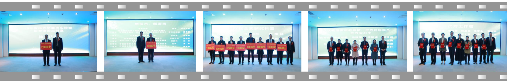
▲徐州医科大学重点实验室培育建设点科室

全科室、绩效考核先进科室、勇挑重担先进个人、优秀工作者和先进工作者代表、服务之星等10多个奖项进行了表彰。 获奖代表院长助理、医务处处长、肿瘤科主任孙立柱和肾内风湿科主任徐敏作典型发言。(文/邱添)